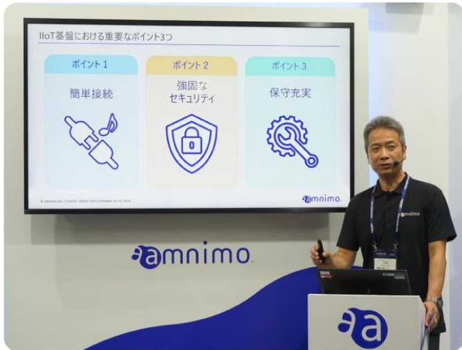
「簡単で安全なIoT」を実現するアムニモIoT基盤 (マーケティング 鳥越研児)